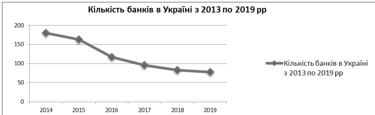
Рис. 1.2.1. Складено за даними сайту НБУ https://bank.gov.ua

Тим більше, що названі суб'єкти господарювання спроможні самостійно впливати на вирівнювання фінансового ринку за потреби та з урахуванням можливих ризиків для власної діяльності. Зокрема, вони правомочні приймати рішення щодо зниження комісійних витрат за переказ коштів, підвищення депозитних ставок тощо, у разі дефіциту іноземної валюти на банківському ринку України.