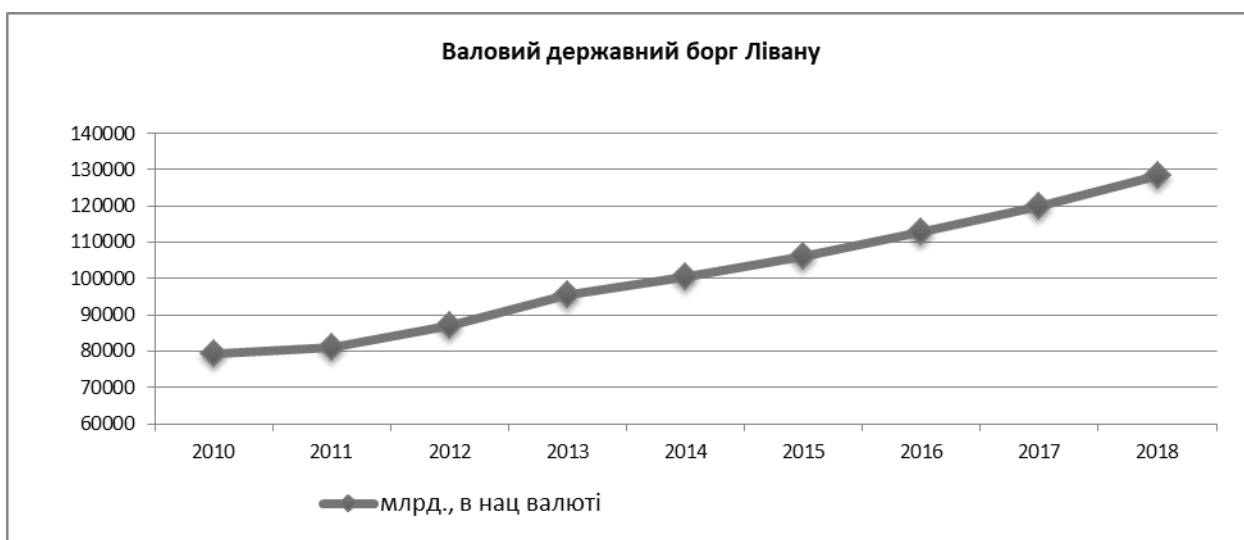
Рис. 1.2.2. Складено за даними сайту https://knoema.ru

відносному вираженні. Протягом останніх десяти років обсяг грошових переказів в країну становить понад 7 млрд дол. США на рік [48], що дорівнює в середньому 14 відсоткам ВВП [49]. За даними Міжнародного валютного фонду таким способом, у 2016 році Ліван отримав в розрахунку 1500 дол. США на людину (більше, ніж у будь-якій іншій країні світу). Це дозволяє дійти висновку про те, що грошові перекази дійсно відіграють провідну роль в економіці країни. Крім того, грошові перекази є джерелом іноземної валюти, яке більш ніж на половину перевищує обсяг експорту товарів країни та допомагає Лівану підтримувати стабільний обмінний курс національної валюти в умовах значного державного боргу (рис. 1.2.2) [50; 51].