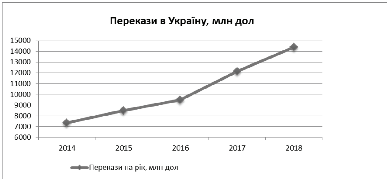
Рис. 1.2.6.

Вихід з ситуації можливий за умови вжиття заходів по стимулюванню розвитку підприємств з високим рівнем доданої вартості та збереженню конкурентоспроможності внутрішніх галузей. Зокрема, завдяки впровадженню Центральним банком програм пільгового кредитування для таких підприємств, в тому числі шляхом спрямування переказів у відповідні галузі. Не останню роль в цьому процесі відіграє перегляд умов режиму таргетування інфляції. Адже підвищення облікової ставки НБУ (інструменту режиму таргетування) призводить до подорожчання кредитів і робить їх практично недоступними, зокрема для переробних галузей (з високим рівнем доданої вартості).