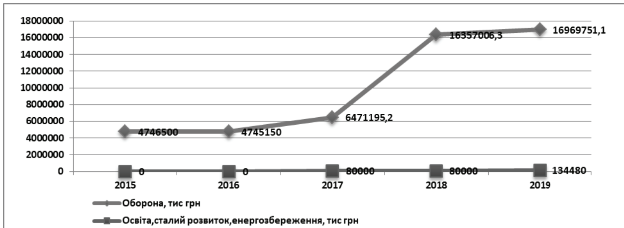
Рис. 1.2.7. Бюджетні видатки на розвиток “озброєння та військової техніки Збройних сил України” та “освіти, сталого розвитку, енергозбереження”. Складено за даними Державних бюджетів на 2015 – 2019 роки [60-64]

Попри це, вищезазначені заходи потребують ще й сильної політичної волі та зацікавленості з боку державних органів. Слід визнати, що для Уряду є більш вигідним проведення стимулюючої політики переказів. Ці кошти дозволяють менш чутливо реагувати на потреби суспільства. Сім'ї, які отримують грошові перекази, краще захищені від економічних шоків і менше зацікавлені в тому, щоб вимагати змін від державних органів; державні органи, в свою чергу, в меншій мірі вважають себе зобов'язаними бути підзвітними перед своїми громадянами.