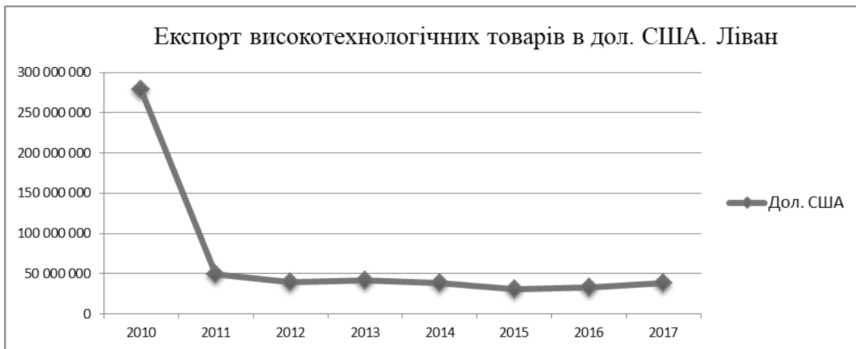
Рис. 1.2.4. Складено за показниками Глобальної бази даних https://knoema.ru/

Обсяг цієї галузі в економіці країни та міжнародному ринку дуже низький (особливо у порівнянні з 2010 роком) (рис. 1.2.4).